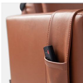
B – Poche latérale séparée