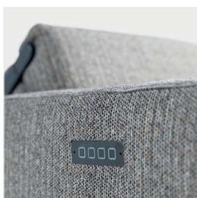
A – Boutons de commande à l'extérieur